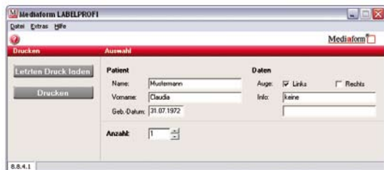
Abb.: Druckprogramm für Augenkliniken

Mediaform ist spezialisiert auf die Einführung von Patientenarmbandssystemen in unterschiedlichen medizinischen Einrichtungen. Integrität in vorhandene IT-Infrastruktur und Praktikabilität in der täglichen Anwendung, das sind die Ansprüche an die Lösungen, die Mediaform gemeinsam mit seinen Kunden entwickelt.